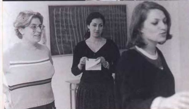
Εργαστήρια και άλλες δραστηριότητες